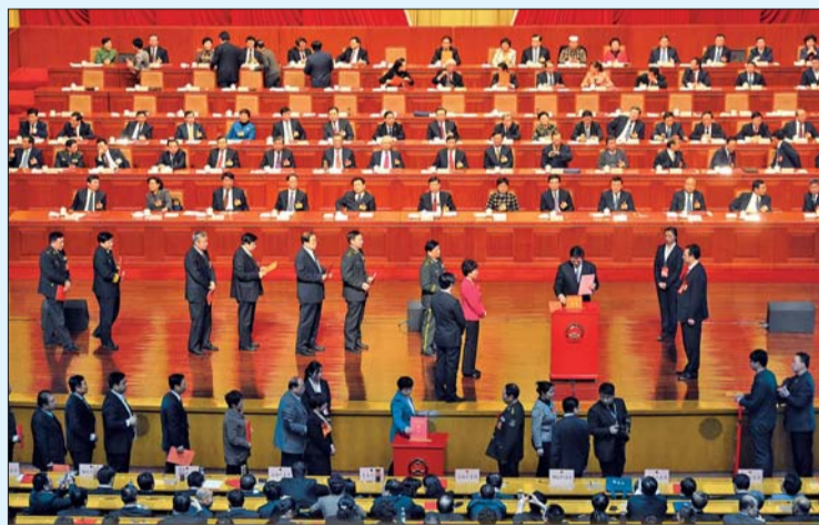
▲1月31日,十二届省人大代表选出省人大常委会、省政府领导班子,图为代表们在依次投票。