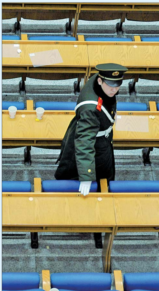
▶1月31日下午,省十二届人大一次会议在山东会堂举行第三次全体会议。图为会议结束后,工作人员认真检查会场。

新交规对救护车等特种车辆作出了保护规定,驾驶人如不避让将被扣3分。保障特种车辆通行,人们没有异议。可是,救护车等特种车辆滥用警报器、警示灯的情况也时有发生。特种车辆该如何管?如何才能既保障车辆通行又防止权力滥用?