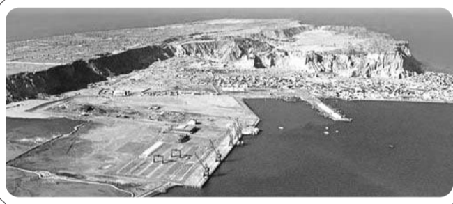
►瓜达尔港码头及港口全貌。(资料片)

获得瓜达尔港的管理权对中国或许有重大战略价值,因为来自中东和非洲的石油天然气商船可以直接停靠瓜达尔港并将货物通过铁路运输直接运抵中国,绕开马六甲海峡。不过,也有分析人士认为,随着中缅石油天然气管道的开通,单从能源运输方面衡量,瓜达尔港对中国的战略价值大大降低。虽然这是一项商业交易,但必定会受到美国和印度的密切关注。中国在南亚港口的任何利益扩张都可能加强印度对受到中国“围堵”的担心。