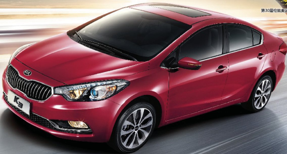
第30届伦敦奥运会乒乓球冠军 张继科