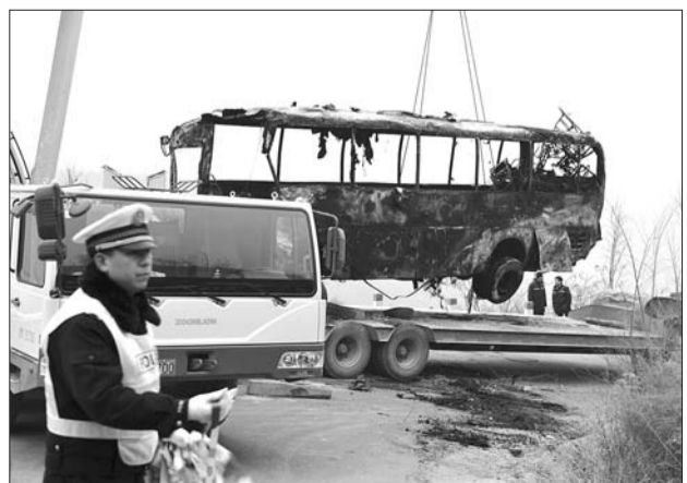
甘肃宁县车祸现场。