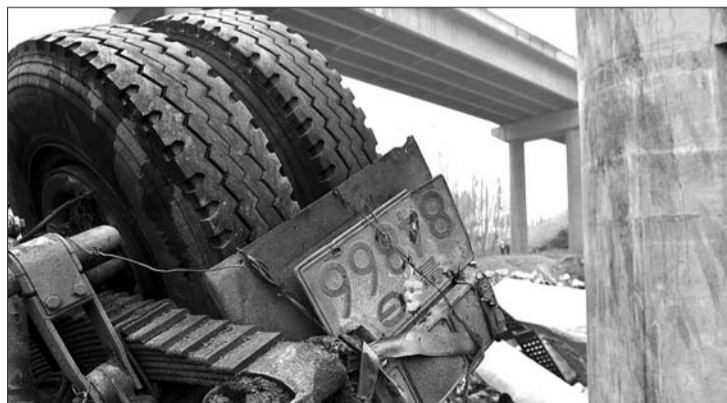
挂着鲁G84866牌照的车是一辆20米长的大货车。

本报渑池2月2日讯(特派记者 张泰来 见习记者 宋磊) 2日上午,记者在现场找到了一辆受损严重的山东牌照大货车,但未在医院发现山东籍的伤员。