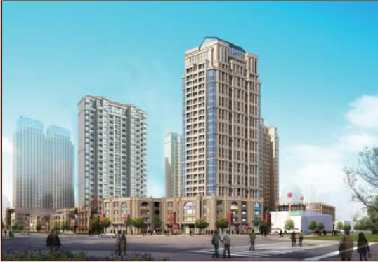
滨州富泰置业有限公司 代表楼盘:中央公园