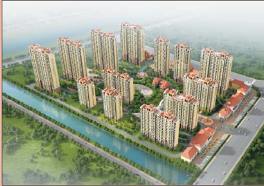
滨州建设集团·滨州市建设房地产有限公司 代表楼盘:新河·金都花园