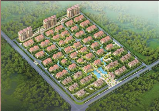
山东和居置业有限公司 代表楼盘:和居·香溪翠庭