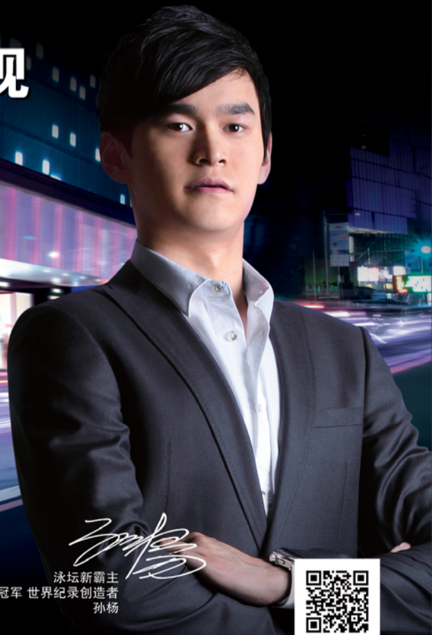
泳坛新霸主 奥运冠军 世界纪录创造者 孙杨