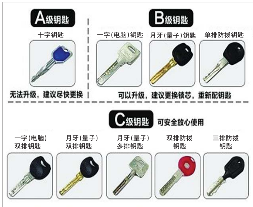
网上流传的钥匙分类图。

“现在小偷入室盗窃,开锁的方法不外乎暴力撬锁、锡纸、撞锁技术开锁这几种方法。”张春发说。