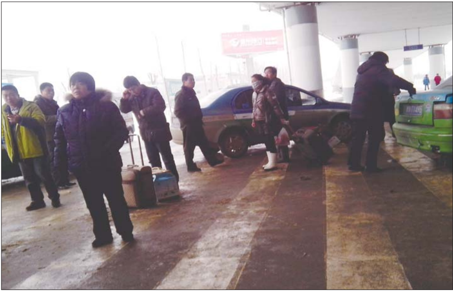
5日,仍有出租车在谈价钱揽客。

短短的2个小时左右,记者观察到尽管值班人员不停地劝阻出租车辆,仍然挡不住部分司机揽客、加价等行为。一辆出租车拼上了四五位乘客,司机才满意地离开。不少乘客认为,