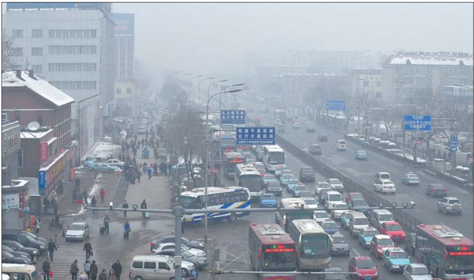
2月6日,春运紧要关头,济南市区又被雨雾笼罩,能见度很低。

建议性污染减排措施为,倡导公众及大气污染物排放单位自觉采取措施,减少污染排放。主要包括尽量乘坐公共交通工具出行,减少小汽车上路行驶;排污单位要控制污染工序生产,减少污染物排放;加强施工工地扬尘污染防治。