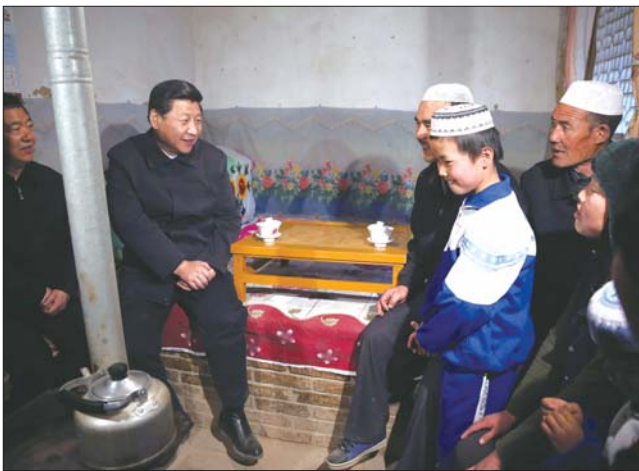
3日,习近平在甘肃调研,看望东乡族困难群众。