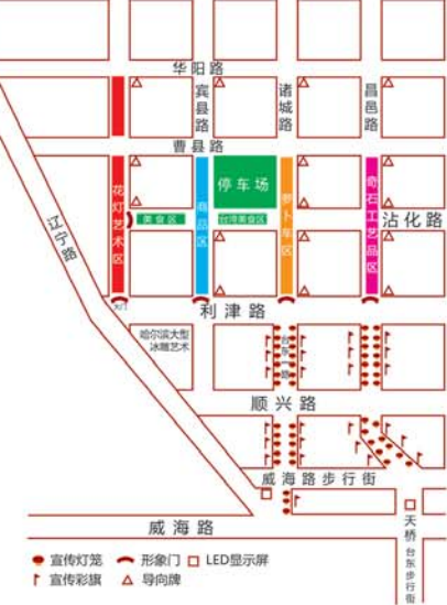
萝卜会·元宵山会布局图。

将制定方案,对周边道路实行临时管制措施,实行调流,届时将提前公布调流路线和方案。”市北交警大队工作人员说。此外,为缓解垃圾清运、如厕难问题,会场还将安排专门的垃圾清运车辆,并增设移动公厕4座。