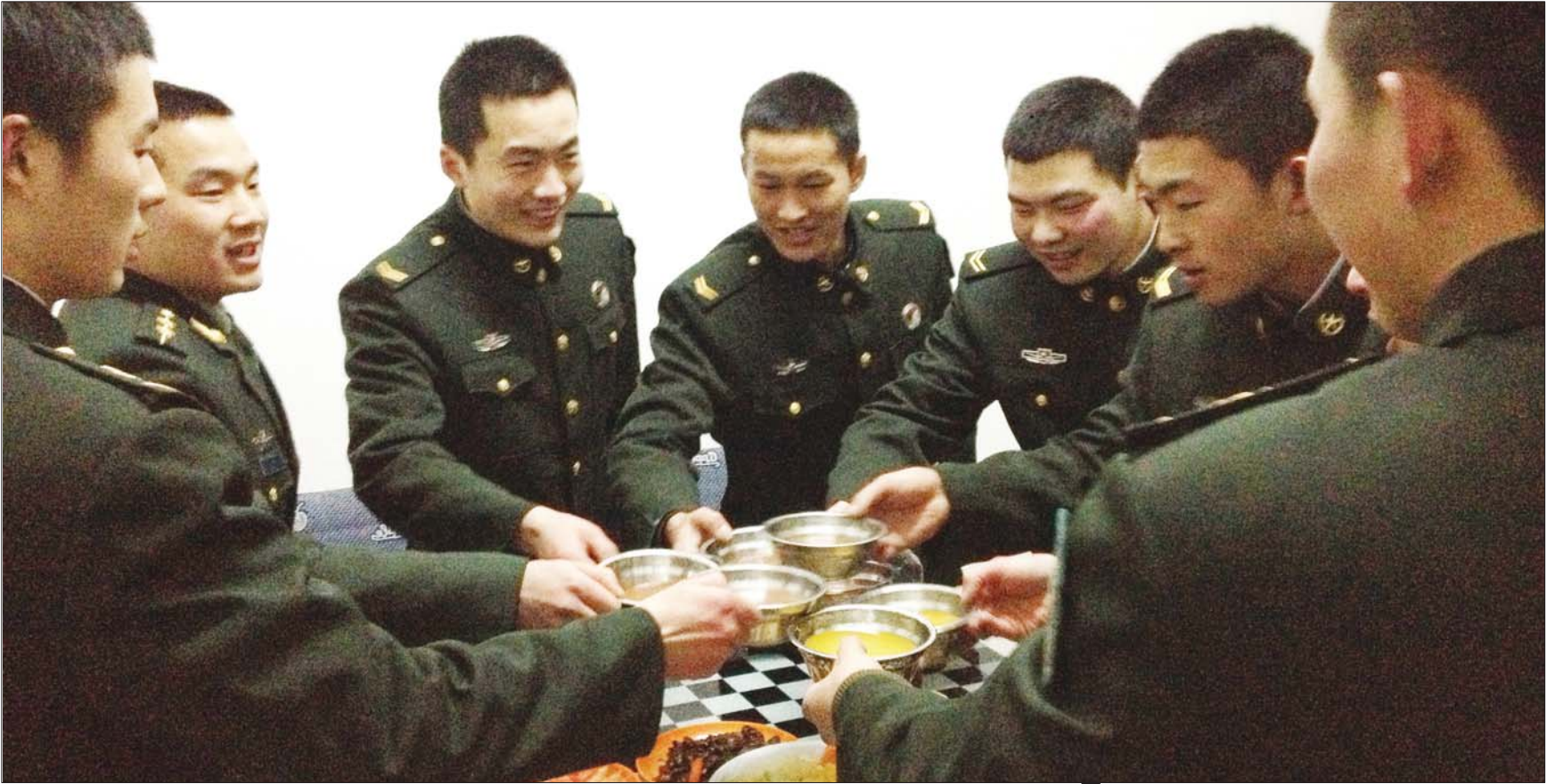
在祖国的最东端，“东方第一哨”里的年夜饭很简单。