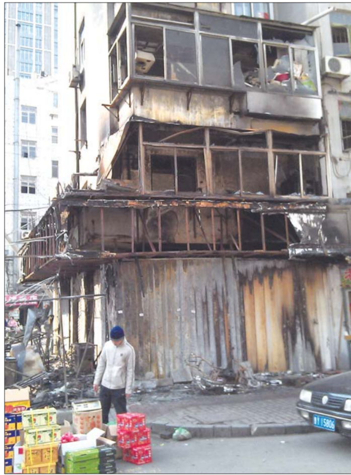
▲来到和合胡同,映入眼帘的是一幅劫后的残破景象。