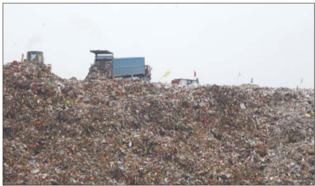
▲今年春节的生活垃圾比往年少了些红色。

烟台市环卫处工作人员介绍,春节期间飘落满地的鞭炮屑使环卫工人的劳动强度增大数倍,随着市民环保意识的增强,鞭炮燃放渐趋理性,今年春节期间,市区产生的鞭炮垃圾比去年减少了三成。