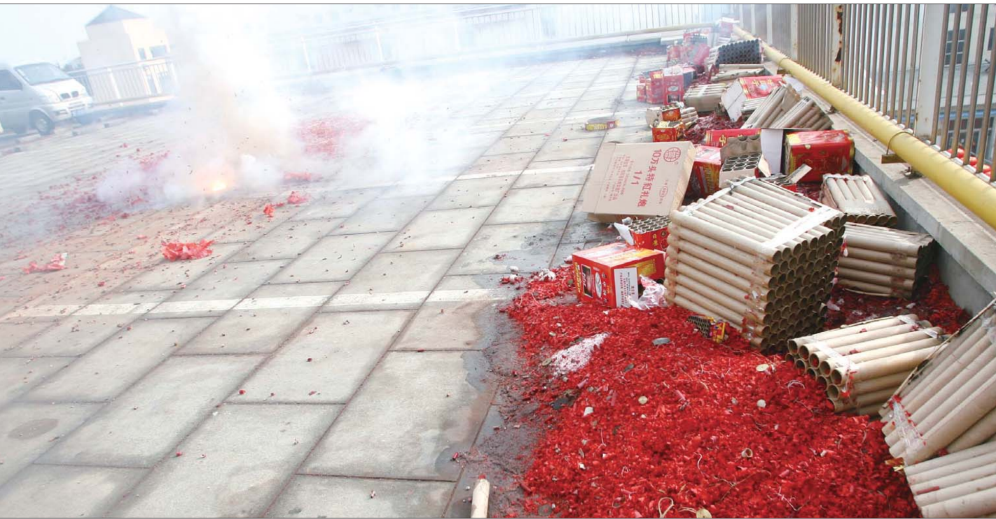
▲鞭炮能带来喜庆,也能带来灾祸,还能污染空气,图为金沟寨附近一处广场上在放开门炮。