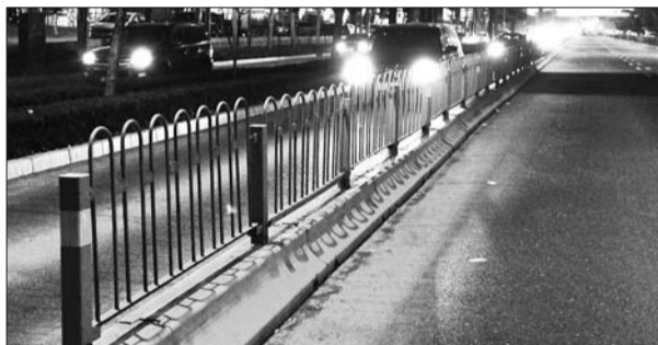
2月18日晚,历山路上的BRT车道。

“有没有护栏关系都不大,即使出现个别情况,相互让一让也慢不了多少。”18日,一名BRT驾驶人在听说此消息后向记者表示。也有不少市民认为,拆了BRT护栏,要采取切实可行的措施保障公交的优先权,快速公交快不起来,行车难依然难缓解,道路优化改造的目的也很难达到。