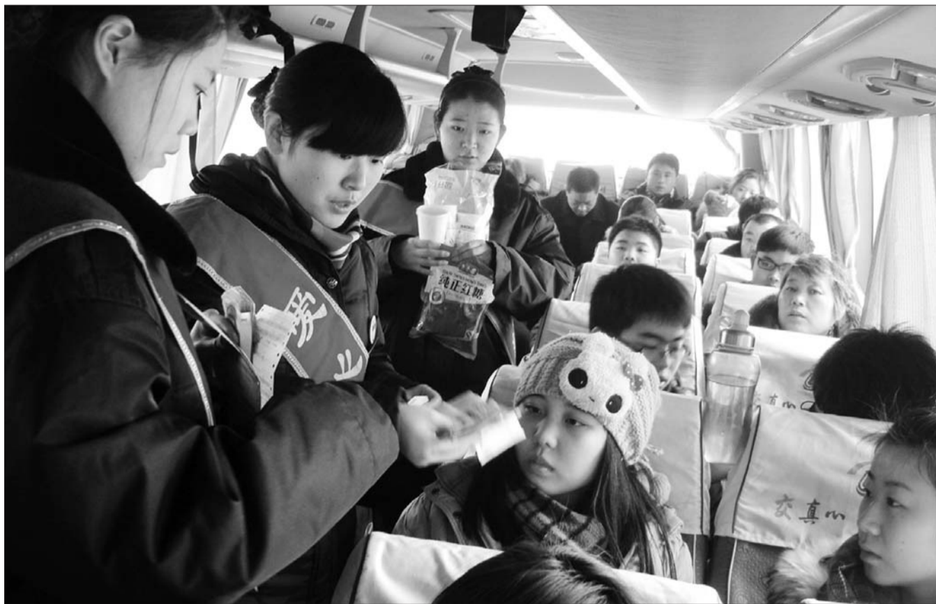
聊城汽车总站工作人员到车上为艺考生送票。

班班次,售票区在每个售票房区内均放置了对讲机,对于旅客询问较多的车票已预售完的班次及时联系站务科设置加班车,使旅客可以及时出行。增设的加班车中,以北京、烟台、淄博、东营、青岛、胶南、即墨、胶州、临沂、黄岛、日照、上海、苏州、塘沽、天津、潍坊、威海等方向居多。