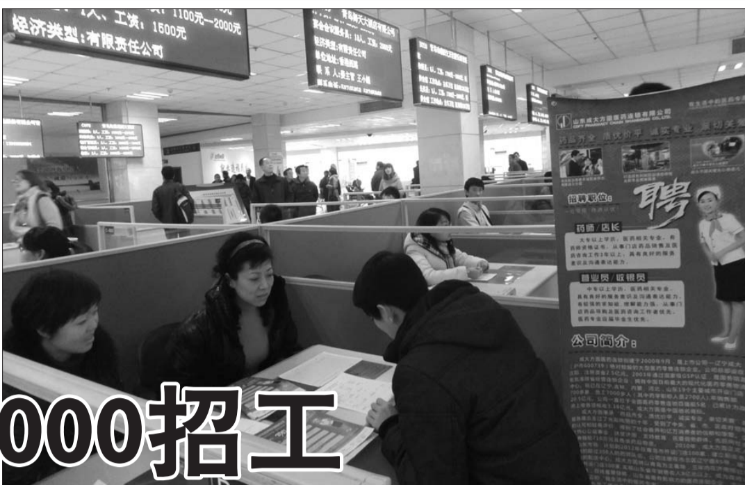
在青岛市人力资源市场里，一家用人单位正在对应聘者进行面试。李晓闻 摄

新年伊始，岛城不少用人单位又现用工荒。为了招满200名技术工人，胶州的一家公司开出了8000元的高薪却依然“吃不饱”。记者采访发现，技能人才不足造成企业人才缺口大，加上有些企业诚信度低留不住人，造成了企业深陷用工荒的困境。