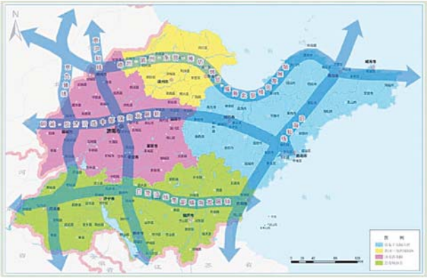
“三横三纵”城镇发展轴线示意图

我省将构建六大农产品供给功能区为主体的农业战略格局。以基本农田为基础,以鲁北、鲁西南、东部沿海三大农产品主产区为基地,以优势农产品为核心,加快构建鲁北低洼平原大宗农产品供给功能区、鲁西南黄淮平原大宗农产品供给功能区、黄河三角洲农牧复合生态调节功能区、胶济山前平原及城郊文化传承休闲功能区、鲁中南山地丘陵农林复合生态调节功能区、鲁东丘陵高效农产品供给功能区。此外,我省还将在重点生态功能区及其他环境敏感区、脆弱区划定生态红线,制定相应的环境标准和环境政策。