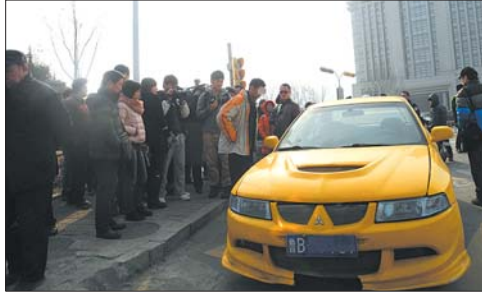
私自改变车身颜色的轿车。

现场,看到黄色三菱汽车停在路边,前车窗干干净净,没有贴交强险和年检标志。驾驶人已经出示了行车证,仍旧未出示驾驶证或身份证。执法民警告诉记者,经上网核查,这辆车从2011年9月份开始就未再年检,超期已经一年多。 驾驶人自称姓王,是一名律师,这名驾驶人一直强调民警执法方式不合适,在路上检查堵住了车流。对于车辆已经过年检期限,驾驶人表示这是借的车,不清楚情况。当被问及有无驾驶证,驾驶人表示有,但是拒绝出示。 僵持了一个多小时之后,驾驶人和车辆被带至历下交警大队进一步处理。经民警核实,该驾驶人驾驶证处于注销状态。