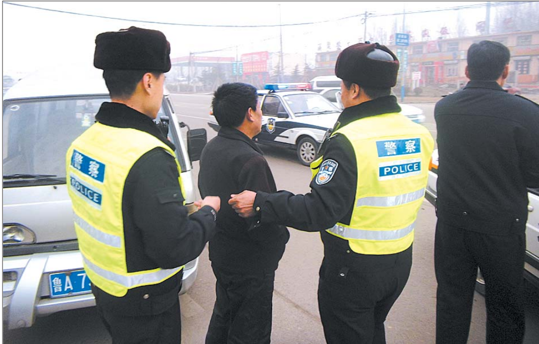
民警查获大量违章的面包车。

本报96706热线消息(记者 崔岩 实习生 王庆珍) 2月18日上午,经市民举报,历城交警查获了一辆多项违章的面包车。这一查不要紧,好家伙,这辆面包车竟然有76次违章没有处理。 2月17日,历城交警大队济钢中队交警接到市民举报,对方称有一辆车号为鲁A7××63的银色五菱面包车违法违章次数很多。 接到举报后,济钢中队迅速对卡口报警车辆信息进行查询并走访调