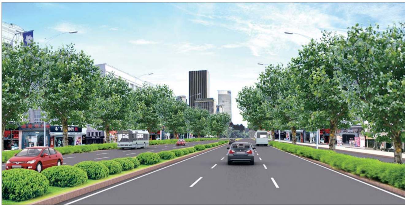
济阳大道(任城大道至北二环)效果图。

本报济宁2月20日讯(见习记者 王洪磊 记者 李蕊) 21日起济阳大道中段(任城大道至拾张线)开始封闭升级改造,改造后的道路宽度将达50米。3月中下旬,济阳大道(金宇路至北二环)将进行封闭升级改造。