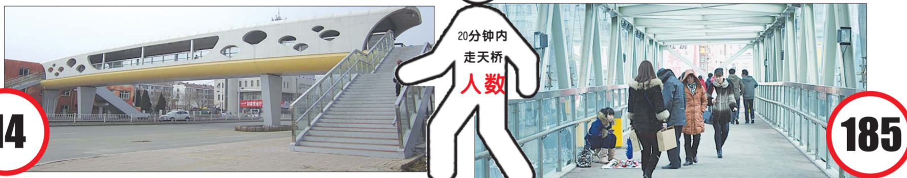
鲁东大学门口过街天桥。