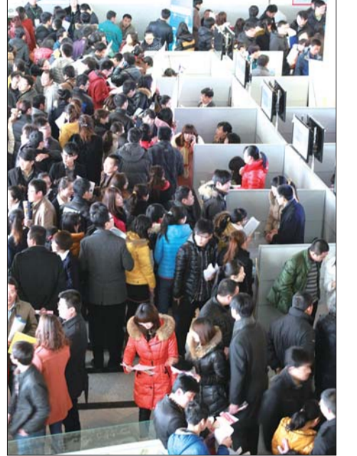
招聘会现场,人潮涌动。