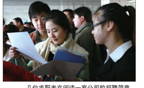
几位求职者在阅读一家公司的招聘简章。