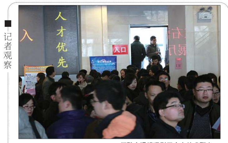
招聘会现场吸引了众多的求职者。