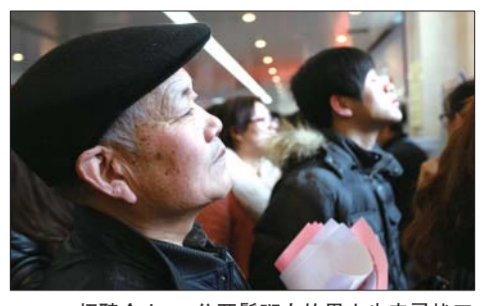
招聘会上,一位两鬓斑白的男士也来寻找工作,发挥余热。

@雨杨梓木:虽然距离自己步入社会还有一段时间,但是明白求职过程的竞争是激烈的,所以在大学学习生活中,我会让自己有一个全面的提升。知识积累和为人处世很重要。想起开复先生给大学生的4封信中对年轻人的希冀,相信自己足够优秀时一定能够在求职中脱颖而出。