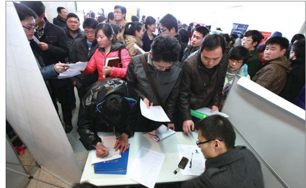
不少热门企业的招聘摊位前挤满了前来应征的求职者。

在东港区一家机械加工厂的招聘展位前边,工作人员正在给应聘者介绍着厂子里的情况。“除了工资以及规定的福利外,每个月我们都会发一些季节性物品,如花生油、果蔬等,让员工工作更踏实。”该负责人说。 “操作工干得时间越长越熟练,对我们的价值也越大,肯定会想方设法留住他们,现在本来就不好招人,熟练的技工更是单位的宝贝。”这名负责人说。他说,由于流动性太大,他们每年都要出来招大量的的一线操作工以及技术类岗位职工。