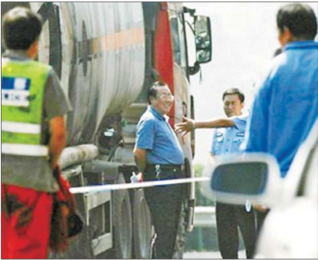
杨达才在“8·26”特别重大道路交通事故现场。(资料片)

高速安塞段发生特大交通事故。一张新闻图片拍摄到陕西省安监局原局长杨达才面带微笑出现在事故现场,引发网友愤怒声讨,网友又“人肉搜索”出杨达才佩戴名表的各类图片。之后,陕西省纪委对杨达才涉及的问题进行了认真调查。此前,杨达才已被撤销陕西省第十二届纪委委员,陕西省安监局党组书记、局长职务。