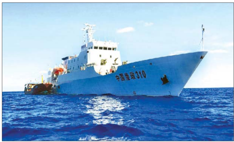
中国渔政310船在黄岩岛海域进行护渔巡航。(资料片)

四总部要求,各级党委要把厉行节约、严格经费管理列入重要议事日程,定期搞好对照检查;各级领导和机关率先垂范,全军部队令行禁止,认真抓好落实。