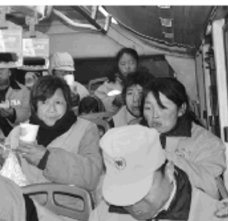
体彩将继续坚持“来之于民 用之于民”的发行宗旨,为社会公益事业添砖加瓦! (张震梅)

关爱环卫工人,积极参与公益活动,聊城体彩一直在行动。除了夏天在体彩站点设置“环卫工人歇脚点”,为环卫工人赠送早餐外,聊城体彩的爱心义举带动了多个社会团体,无论是青少年体育活动,还是捐赠健身器材、爱心助学都有聊城体彩的身影。在新的一年里,聊城