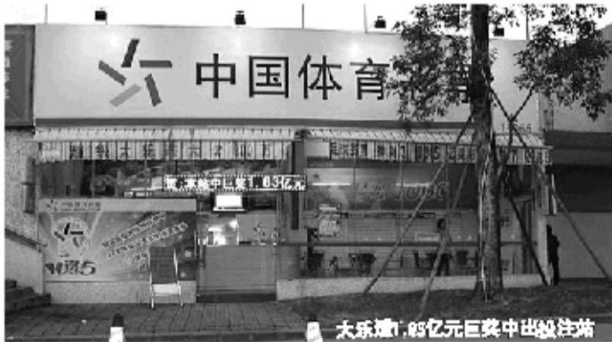
大乐透1.83亿元巨奖中出投注站

1.83亿大乐透得主还真沉得住气!兑奖日一晃已过去6天,据广东中山市体彩中心有关负责人介绍,目前巨奖得主还是音讯全无,关心此事的彩民更是不需要为中奖者算损失,晚1天兑奖等于是扔掉常人1年的工资。