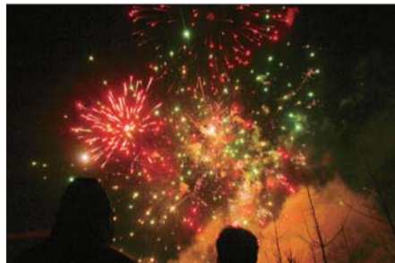
五彩缤纷的焰火。