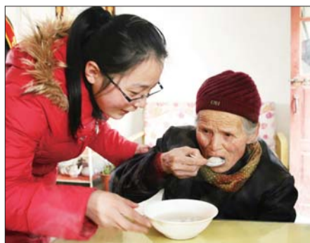
聊城大学商学院学子为桃源山庄老年公寓的老人们送去元宵。