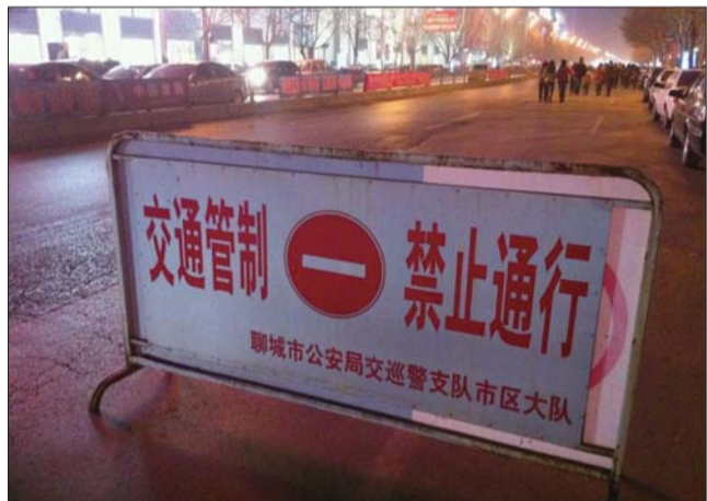
为方便市民看花灯,东昌路等部分路段实行交通管制。