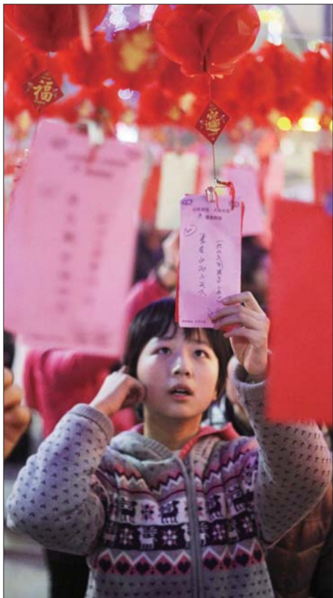
一名小朋友在柳园路一商场门口猜灯谜。