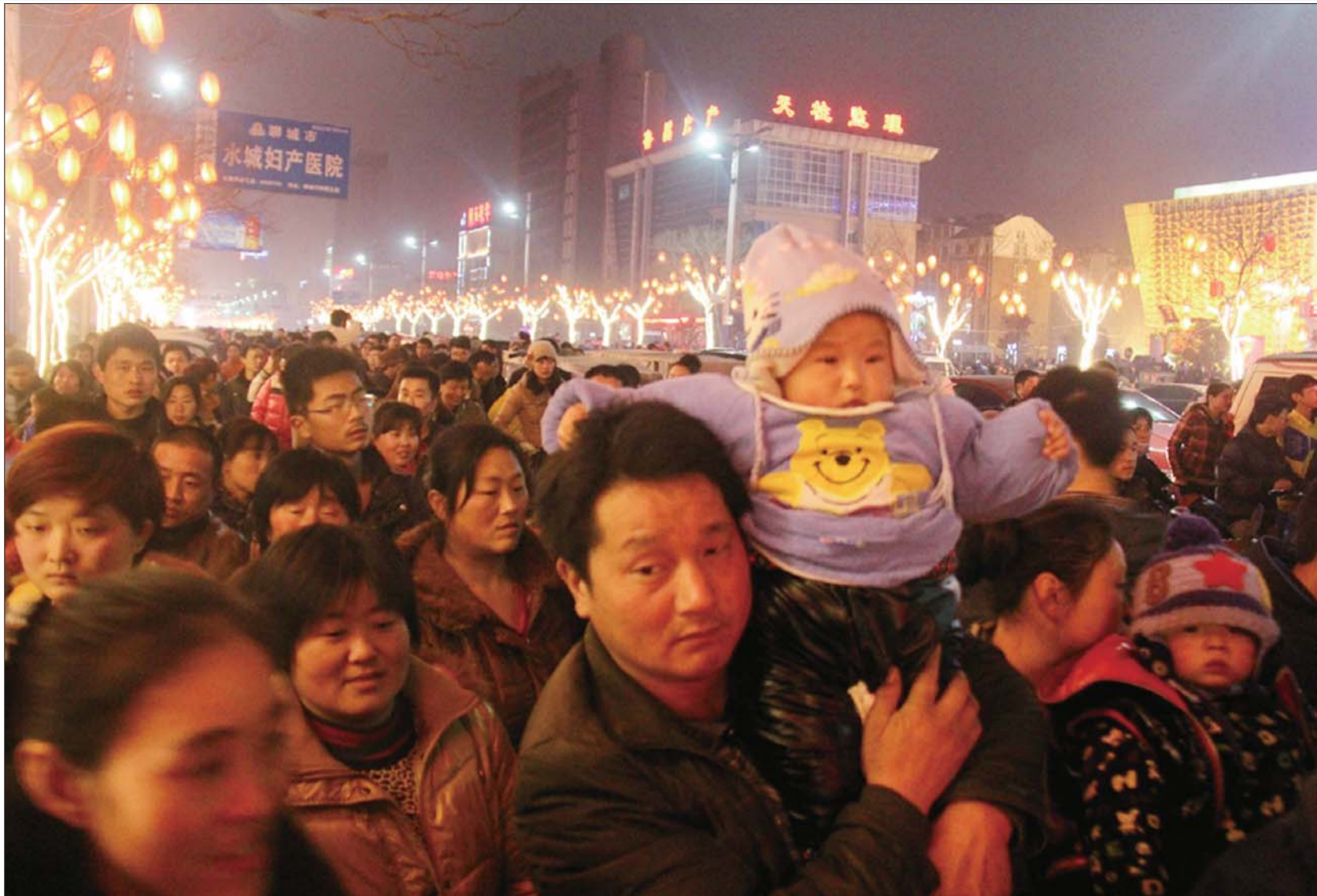
正月十五晚上,东昌路和柳园路上,挤满了前来看花灯的市民。