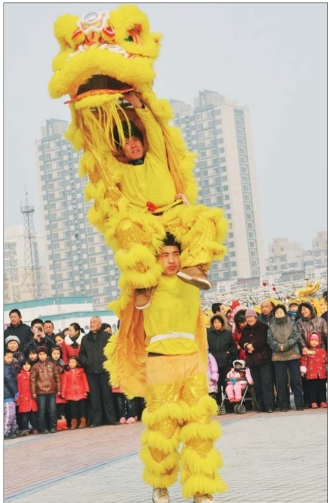
人民广场举行庆元宵节民间文艺表演,演出队在表演民间传统节目——舞狮。