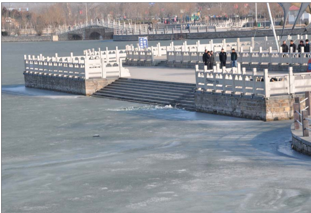
图中靠岸边冰破处便是发现尸体的地方。