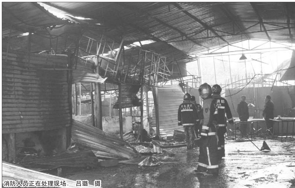
消防人员正在处理现场。吕璐 摄