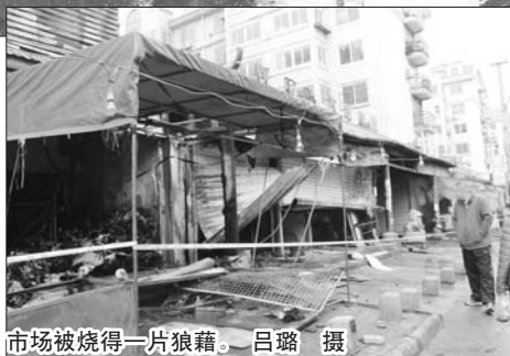
市场被烧得一片狼藉。

本报2月24日热线消息(记者 曹思扬) 24日5时20分左右,宜阳路的双汇隆市场突发大火,十余家摊位被烧个精光,附近小区居民家中的玻璃被烤裂,所幸无人员伤亡。消防部门共出动7辆消防车,约1小时扑灭火灾。居民称市场起火的部分是扩建的,安全隐患重重。