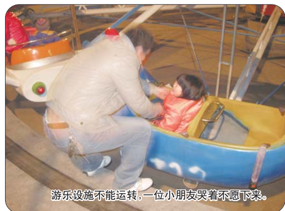
游乐设施不能运转,一位小朋友哭着不愿下来。