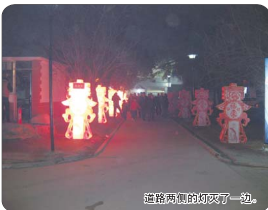
道路两侧的灯灭了一边。