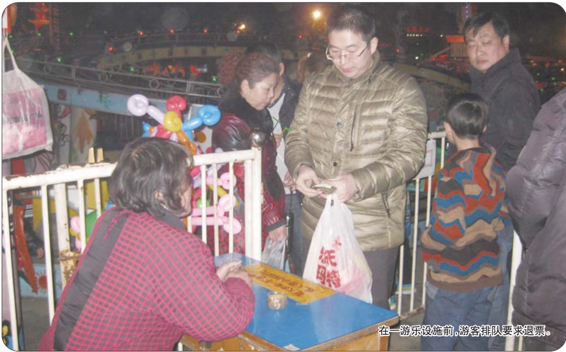
在一游乐设施前,游客排队要求退票。

24日上午,记者在人民公园内看到,工作人员对园内商家连接的电线进行整顿,尤其是禁止使用高瓦数的射灯,以防线路超负荷导致线路故障。随后,记者拨通了人民公园办公室电话,工作人员称23日晚人民公园内的故障是“应急事件”,并于23日晚11点左右修好。