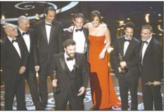
《逃离德黑兰》剧组在领奖现场。

本报讯(见习记者 李婕)在第85届奥斯卡颁奖礼上,备受关注的《逃离德黑兰》击败《林肯》获得最佳影片奖。《逃离德黑兰》去年10月登陆北美院线仅40天后,便由腾讯视频好莱坞影院率先引进到中国,创造了当时国内电影同步北美院线的