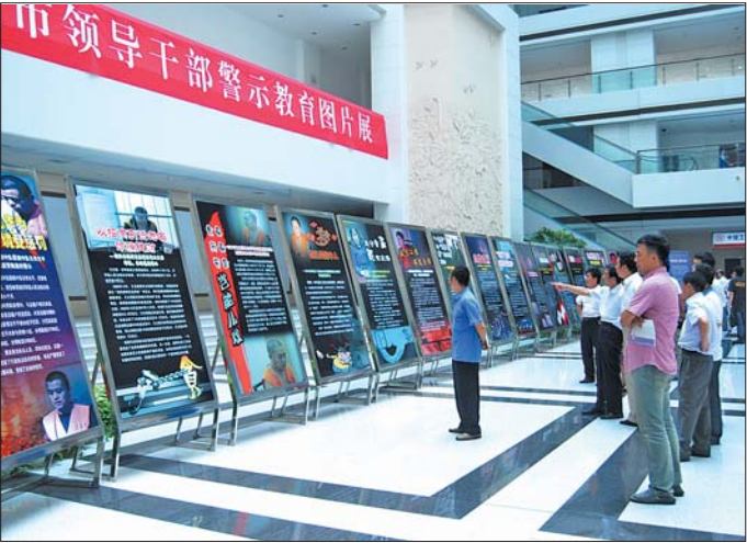
2012年8月,济南市领导干部警示教育图片展上,公务人员在展板前观看。

人为此十分着急。“排在后面的急,前面的也急。”市评议办相关人士说,“前面的担心这次排名高,明年可能会落下来,中间的也着急,急着想提位次,防止跌到后面去。”一些部门围绕群众满意度提出诸如“不后退”,“进前几名”的目标,以此为动力展开工作。跟别人比,还要跟自己比,“横向、纵向看,大家都在较劲儿。”