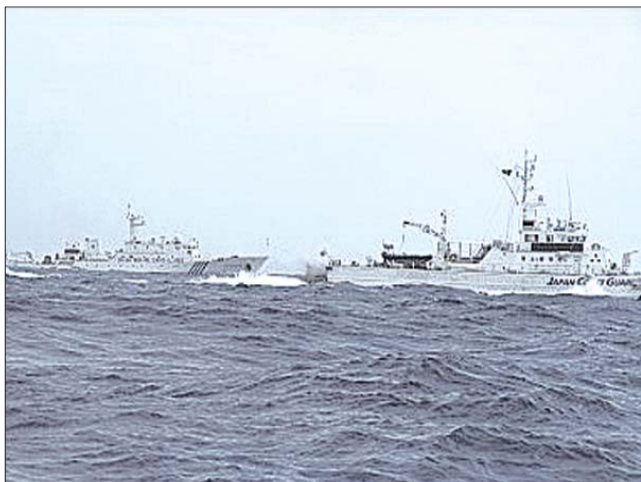
日媒公布的中国“海监66”船急速追踪日本渔船照片,其间日本“水城”号海保巡逻船干扰中国船只。(资料片)

当日在钓鱼岛领海巡航的中国海监船编队发现日本渔船侵入我钓鱼岛领海后,进行了正常的维权巡航执法。该编队并未配备机枪等重型武器,对日本渔船采取的执法行动是完全合理合法的。日方一些别有用心政客和媒体对中国海监船正常的执法活动进行恶意炒作,混淆视听,对中日关系大局构成损害,不利于两国和平发展,无助于问题的解决。