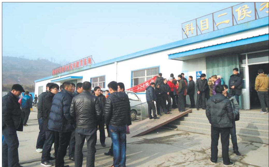
27日,在科目二考试现场,很多学员聚在一起讨论,总结考试经验和教训。

据了解,当天197人参加考试,116人顺利通过,其中不乏满分者。“58%的通过率比我们预计的要高,毕竟学员对于新规还不太了解,慢慢熟悉后可能通过率会有变化。”姜远军说。