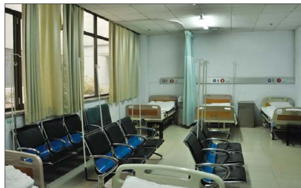
▲27日下午,一家医院的输液室空无一人。

同时,张医生提醒市民,晨练时要尽量选择太阳出来、温度回暖后进行。雾霾天气中,老人及儿童尽量不要在外长时间逗留。而对目前的雾霾情况,张医生表示市民不必过分担