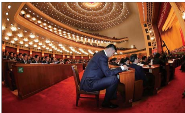
▶3日,全国政协十二届一次会议上,全国政协委员姚明在听会。

@疑似学者:安监局长掉泪了,工商局长掉泪了,那就行动起来吧!让你们负责的行业不再掉链子。