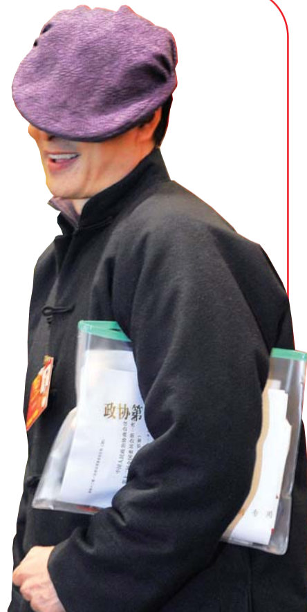
▶3日,北京铁道大厦,全国政协委员濮存昕面对镜头,突然用手拉低帽檐,整个脸只剩下露着洁白牙齿的嘴巴,引得记者哄堂大笑。