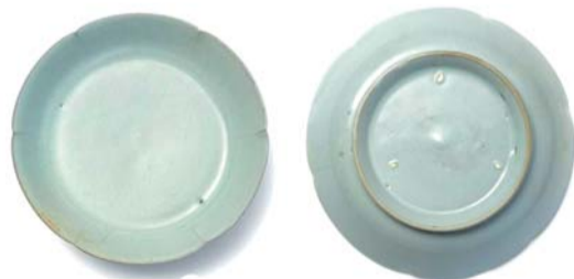
北宋汝窑天青釉葵花洗