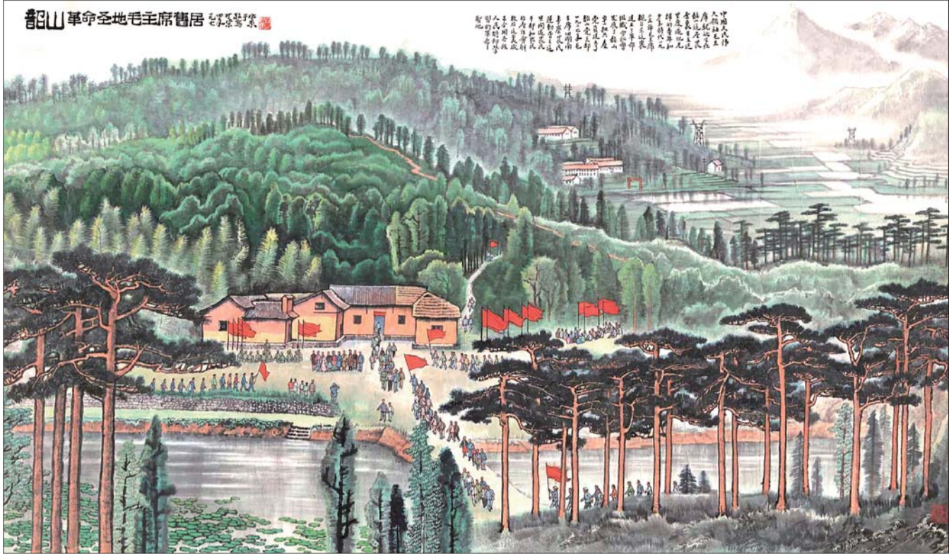
▲李可染 韶山 革命圣地毛主席旧居

“热钱”走了、精品少了、查税风波接踵而至……2012年的中国艺术品市场似乎从未经历过如此“重重磨难”。2012年6月,北京保利近现代书画夜场,李可染《万山红遍》以1.8亿元起拍,2.55亿元落槌,加佣金2.9325亿元成交,刷新李可染个人拍卖纪录的同时,也成为2012年中国艺术品市场成交价格最高的拍品。此后,亿元拍品就很少集中出现了。从2009年末的崛起,到2011年显露下滑的先兆,是什么瓦解了持续两年多的“亿元时代”?