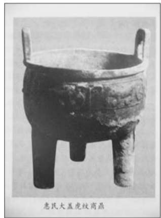
大郭遗址中发现的虎纹青铜鼎说明墓主的身份不一般。

规模较大,已经具备了完善的国家机构,大郭遗址在当时来说就算一个小国家,类似于战国七雄那样的王侯。