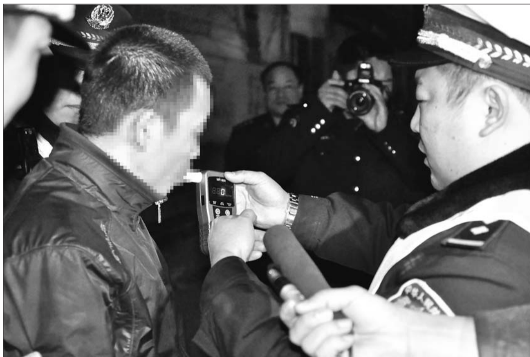
宋某在现场接受酒精呼气检测。

本报枣庄3月3日讯(记者 袁鹏) 2月28日晚,市中区龙山路上,一男子高速行驶一辆摩托车闯过交警设置的第一道检查关卡,继续行驶50米后,被警方查获。