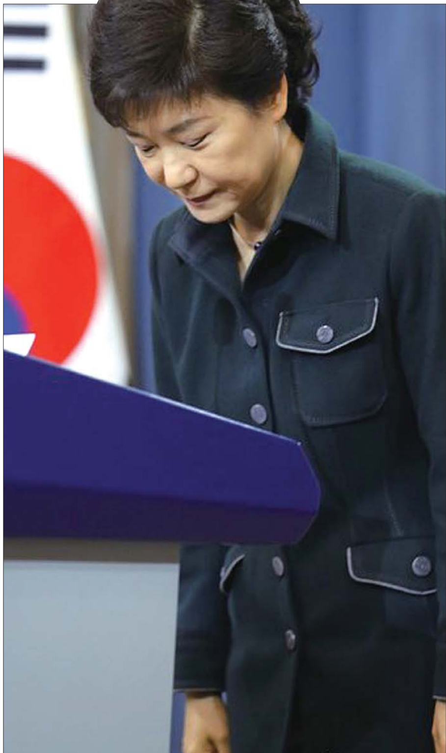
4日，朴槿惠总统在青瓦台发表声明——“对国民谈话”时，向国民鞠躬道歉。