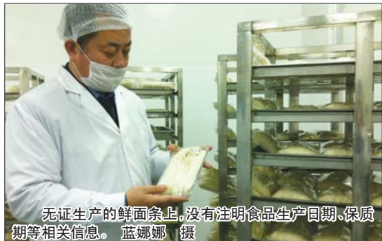
无证生产的鲜面条上,没有注明食品生产日期、保质期等相关信息。

就在无证鲜面条被查处后,执法人员意外在成堆的面粉原料中看到,一家名为“品品好”的面粉包装上,QS生产许可标志标注的字