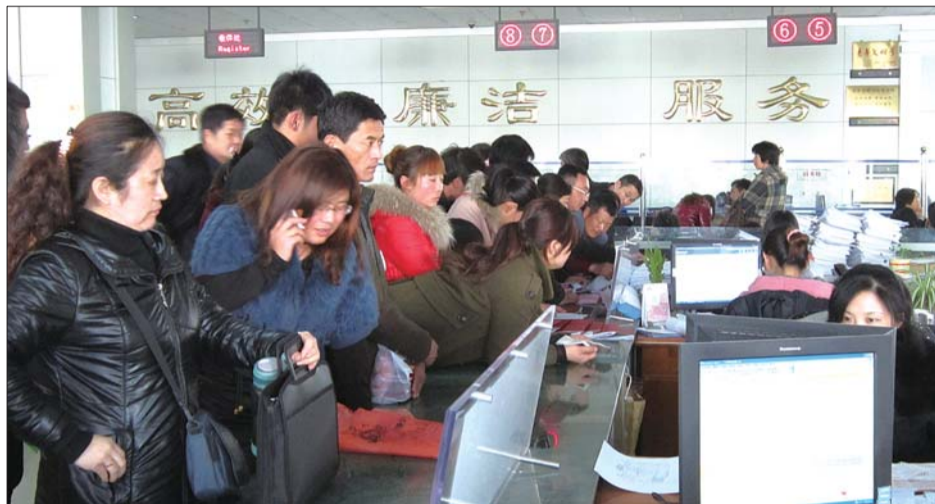
4日下午,日照市房产交易大厅里,市民扎堆办理二手房相关业务。

据了解,目前对于5年以内的二手房,交易后个人所得税政策执行有两个标准,一是按照交易房屋总价的1%征收,二是计税标准则是按照差价20%征收,截至目前,两种计税办法同时并行。不过在实际操作中一般按房