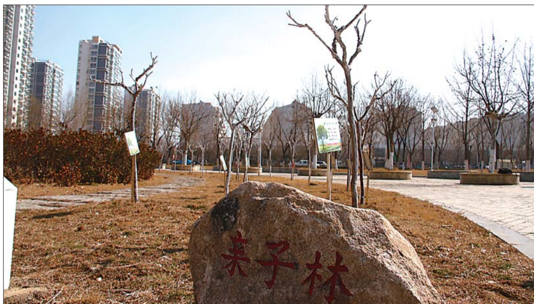
位于沙墩河公园的亲子林,在园林工作人员的细心呵护下茁壮成长。本报记者 刘涛 摄

本报3月5日讯(记者 彭彦伟 通讯员 马佳梅)“种一棵树跟孩子一起成长,种一棵树,清新我的家园。”3.12植树节来临之际,本报与日照市园林管理局共同举办的第二届“我和小树一起成长”亲子林认建活动正式招募亲子家庭。3月16日,带着您的孩子一起去银河公园植树吧。