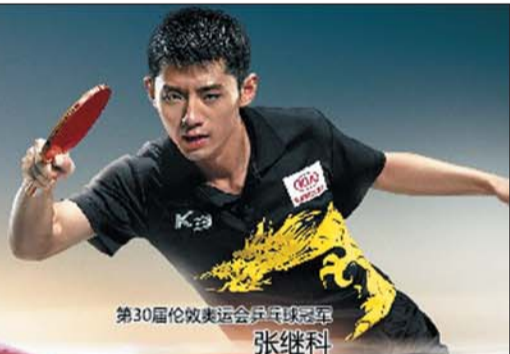
第30届伦敦奥运会乒乓球冠军 张继科