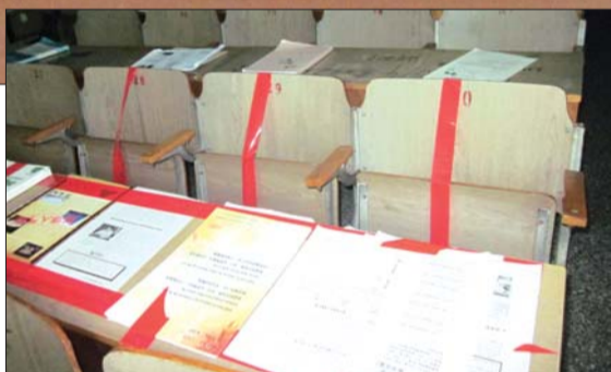
为了占座,学生将桌椅用胶带粘住。

记者在走访中了解,不少同学喜欢占据后排和靠近窗户的座位,原因是阳光好、不易被打扰。虽然座位都被占满,但是真正来的人屈指可数,有些教室在上课期间甚至是空无一人,同学们的抢座热情与学习热情形成强烈反差。