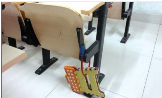
在座位上锁上板凳以示占座。