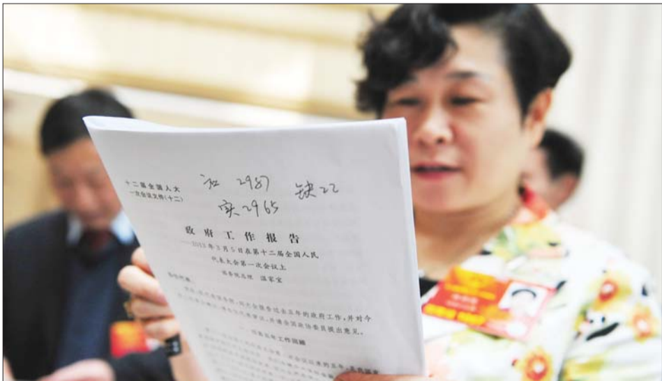
5日,温总理作过政府工作报告后,一名代表对报告进行审议。

全国人大代表、律师韩德云认为,政府工作报告提出这个词,显示了政府破除障碍、推进改革的决心。