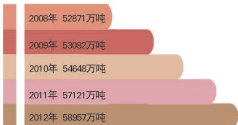
过去五年我国粮食总产量实现连增