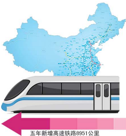
五年新增高速铁路8951公里