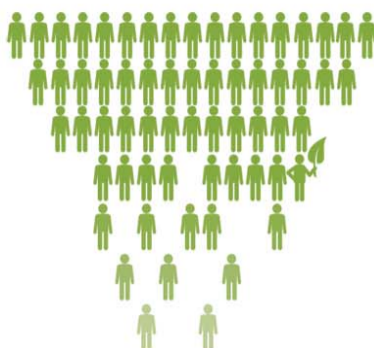
现有1260万农村户籍孩子 在城市接受义务教育