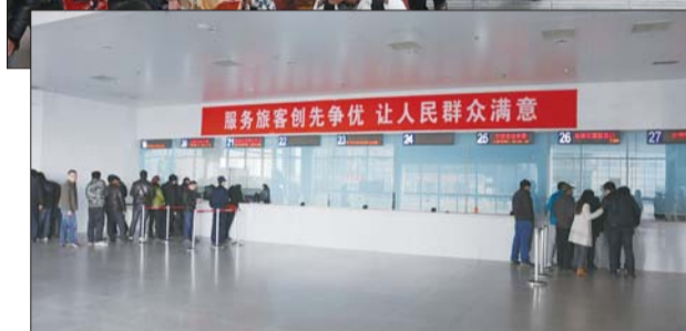
▲2月底,火车站迎来一轮返程小高峰。