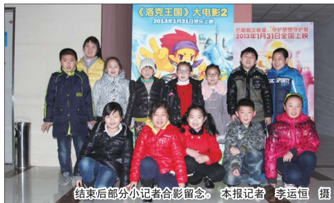
结束后部分小记者合影留念。

次有新片上映的时候,孩子都会问什么时候组织一起去看电影。课余时间也不至于让孩子们太无聊。”家长朋友们对于本报小记者活动有好的建议可以直接拨打本报电话:0543-3211123告诉我们,也可加入QQ群56794054进行讨论。