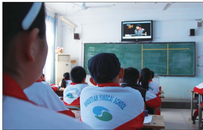
授田英才学园的学生们在认真观看《感动中国》节目,还会在本子上记录下自己印象最深的人。

在开发区定吕小学将勤俭节约作为开学第一课,节约作业本、校园垃圾分类处理、教室人走关灯等等,让学生自己制定节约方案,从身边小事儿做起,倡导节约。