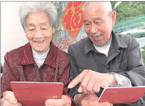
枣庄东龙头社区居民领到了新农保的养老金。(资料片)

来看,社保基金收支总体平衡,还有结余。”于国安说。 省社保局局长孙廷玉此前接受媒体采访时也表示,目前养老金按时足额发放有充足的资金保障。 全国人大代表、济南市市长杨鲁豫说,济南市虽然是老工业城市,但2012年企业职工的社会养老保险基金实现收支平衡,略有结余。 “所谓的养老金缺口其实是个未来的话题。”全国政协委员、人力资源和社会保障部副部长胡晓义表示,目前全国养老金没有缺口,而且有结余。但随着社会老龄化的加剧,会面临缺口的问题。 杨鲁豫说,以济南市为例,近年来老年人口不断递增,目前济南60岁以上的人口占总人口的17.5%，“十二五”末将上升到20%。在岗的职工减少了,退休老人增多了,直接影响到社保基金,特别是给养老保险基金带来较大的压力。