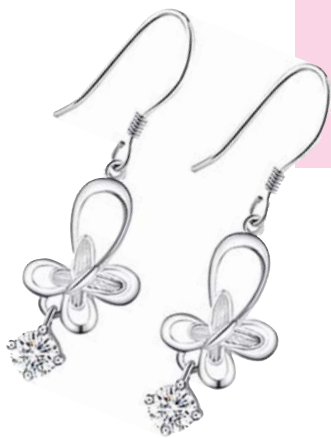
蝴蝶造型钻石耳环

豆蔻年华,是女孩儿最纯真的烂漫季节,那种美,就像春天初绽的花朵,那么清新、那么纯美……如果你是个喜欢穿浅淡颜色连衣裙的甜美女孩儿,那么蝴蝶和花朵造型,趣味图案等,色彩柔和的珠宝会是你的最佳选择。