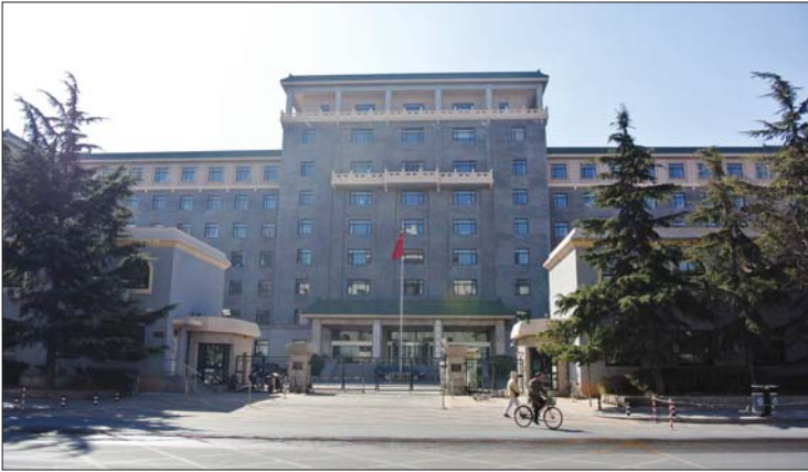
国家能源局的办公大楼

这次改革将现国家能源局、电监会的职责整合,重新组建国家能源局,主要是为了更好地统筹推进能源发展和改革,强化能源监督管理,促进能源行业健康发展。